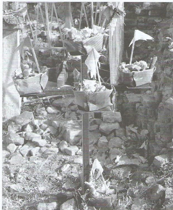
นำกระทง (ควัก) วางไว้บนแท่นบูชาแล้วบอกกล่าวท้าวทั้งสี่ทิศ

5. เครื่องบูชาดินเส้าหอ จำนวน 6 กระทง (ควัก) ประกอบไปด้วย กล้วย 1 ผล ข้าวต้มมัด 1 อัน อ้อย 1 กีบ