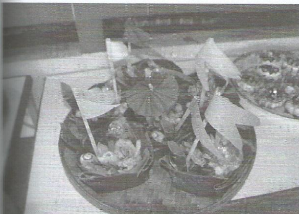
กระทง (ควัก) บูชาท้าวทั้ง 4

ขาตั้งถาดใส่เครื่องบูชา ขนาด 80 เซนติเมตร มุมละ 1 อัน ตาแหลว 7 ชั้น มุมละ 1 อัน เครื่องพิธีกรรมที่ใส่ถาดบูชา ถาดละ 1 ชุด จำนวน 4 ถาด ประกอบด้วย ข้าวต้มมัด 108 อัน มะพร้าวซอย 108 กีบ มะม่วงดิบซอย 108 กีบ ส้ม เชียวหวาน 108 กีบ อ้อย 108 กีบ หมาก 1 ซ้อ พลู 1 ใบ ทาปูนแดงมัดติดกัน 108 อัน เหมียงห่อตองเป็นอม 108 อม บุหรี่ซีโยพันด้วยตอง 108 มวน ข้าวเกรียบ 1 ถุงใหญ่ ข้าวแต่น 1 ถุงใหญ่ กล้วยน้ำหว่าสุก 1 หวี น้ำดื่ม 1 ขวด ข้าวเหนียวสุก 1 กระทง สวยดอกกอนป่า เทียน 2 เล่ม 1 สวย ข้าวได้