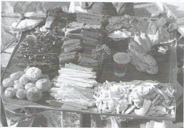
นำเครื่องถวายต่าง ๆ จัดลงถาดวางไว้บนแท่นถวายทั้งสี่ทิศ